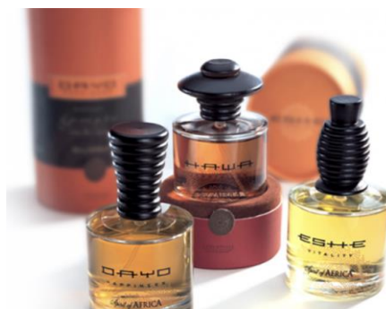
Рис.1. Пример айдентики линейки женской парфюмерии «Spirit of Africa» от бренда Atkinsons

Если рисунок заимствован из учебника, монографии или научной статьи и т.п., то есть не является авторским, то ссылка на источник обязательна. В данном случае в квадратных скобках указан номер из списка литературы, под которым стоит название источника, и номер страницы, где приведен рисунок.