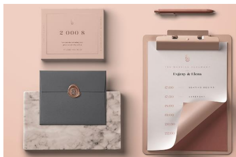
Рис. 2. Визуальная концепция в макете [8]

Если рисунок заимствован из учебника, монографии или научной статьи и т.п., то есть не является авторским, то ссылка на источник обязательна. В данном случае в квадратных скобках указан номер из списка литературы, под которым стоит название источника, и номер страницы, где приведен рисунок.