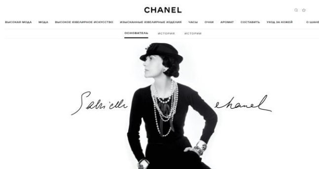
Рис. 4. Оформление главной страницы официального сайта бренда Chanel [36]

Рисунок не должен занимать более 1/3 страницы. В исключительных случаях разрешается его объем увеличивать до 1/2 страницы. Если размер рисунка превышает данные требования, либо при его уменьшении информация, размещенная в нем, становится «не читаемой», то такой рисунок (схему, диаграмму, график) переносят в приложение и увеличивают до необходимого для его прочтения размера.