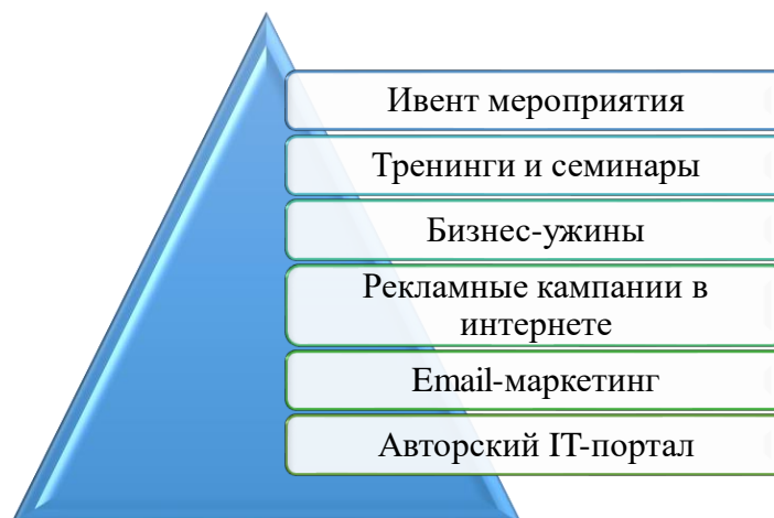
Рис. 1. Маркетинговая работа OCS