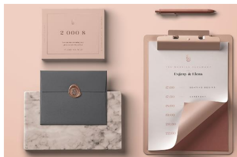
Рис. 2. Визуальная концепция в макете [8]

Если рисунок заимствован из учебника, монографии или научной статьи и т.п., то есть не является авторским, то ссылка на источник обязательна. В данном случае в квадратных скобках указан номер из списка литературы, под которым стоит название источника, и номер страницы, где приведен рисунок.