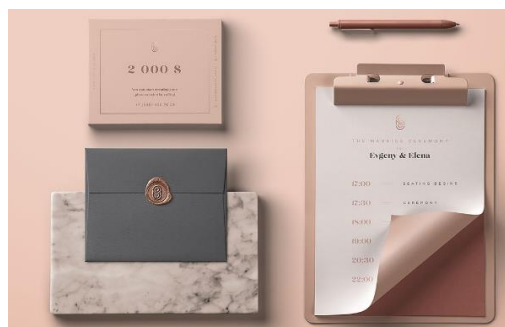
Рис. 2. Визуальная концепция в макете [8]

Если рисунок заимствован из учебника, монографии или научной статьи и т.п., то есть не является авторским, то ссылка на источник обязательна. В данном случае в квадратных скобках указан номер из списка литературы, под которым стоит название источника, и номер страницы, где приведен рисунок.