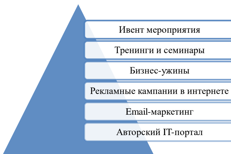
Рис. 1. Маркетинговая работа OCS